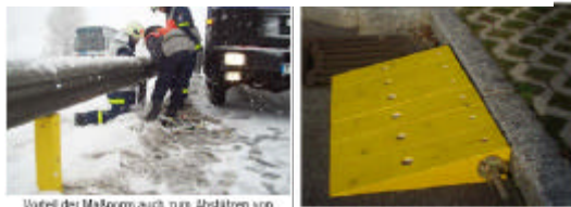
Vorteil der Maßnorm auch zum Abstützen von Leisparkes (50 cm leichte Weite)