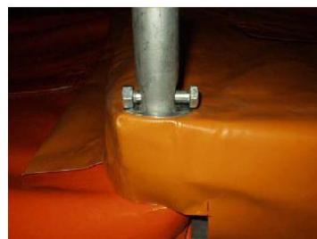
Sicherung der Deckelplanen